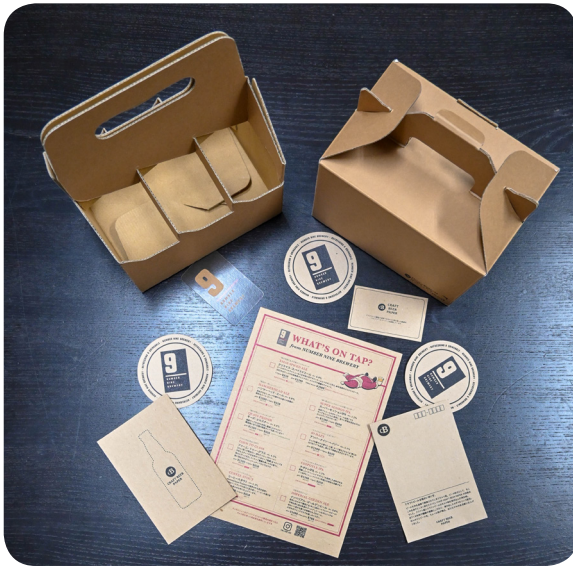
products from kitafuku

ールペーパーを作ることに決めた。彼らが手掛けるクラフトビールペーパーは、横浜ビール醸造所の協力のもと、醸造過程で出る大量のモルト粕を再生紙に混ぜ込み、「届けるところまでビールにこだわる」という企業のストーリーを加えて製品化したアップサイクルプロダクトである。クラフトビールペーパーの開発にあたっては、異物混入と間違われぬように機械の網目の大きさを変え、色合いや手触りなど調整するため試行錯誤を繰り返した。人気のある製品のひとつ、例えばクラフトビールペーパーで作られた名刺はどうだろう。ビジネスで出会う瞬間に交わされる名刺に、「クラフトビール醸造過程で出るモルト粕を使った紙素材を使用しています」と書かれていたら、話題が弾むきっかけになるかもしれない。