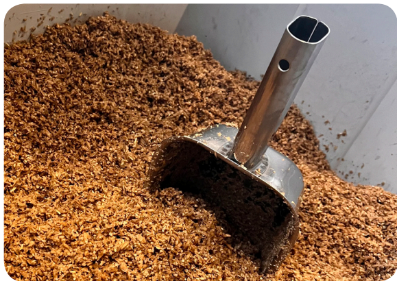
spent grain from Yokohama Beer