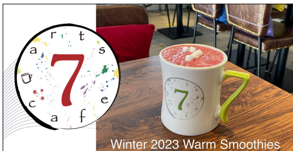
Winter 2023 Warm Smoothies